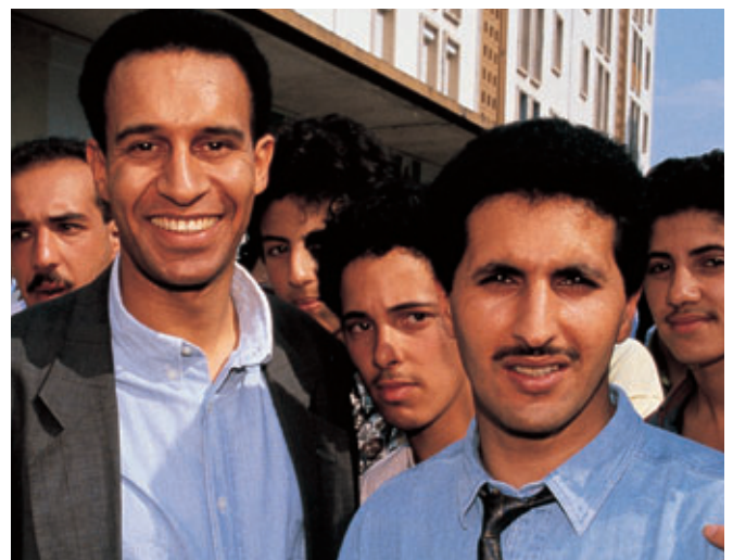
Actualmente, la Región de Murcia se ha convertido en un centro importante de inmigración.